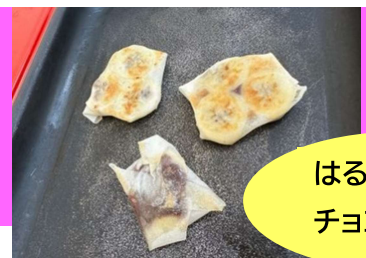
はるまき チョコバナナ