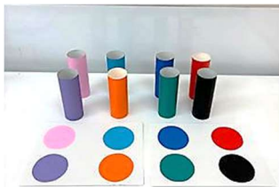
カラータワーゲーム

両サイドにボールがあるのであちらこちらにボールたちが行くことなくゴールできるので、こどもたちでも簡単に参加することが出来ました♪ また、二人で協力して行うことでさらにこどもたちも楽しく参加できていました♪