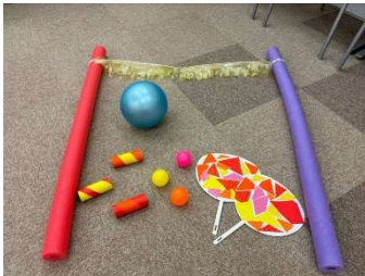
ばたばたうちわゲーム

このゲームでは、うちわでカラーボールやトイレットペーパーの芯で作ったコロコロボールを仰いでゴールに運ぶゲームとなっています。うちわを仰ぐ力(腕力)を鍛えることができ、ボールを目で追うことで洞察力を補うことが出来ます。