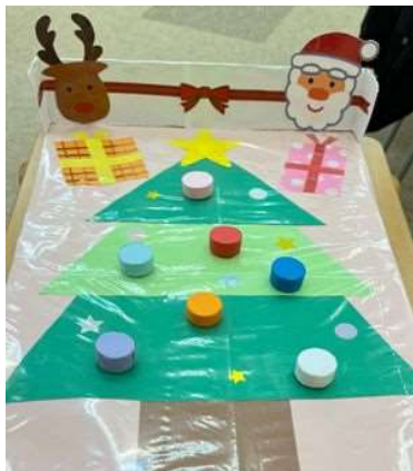
キャップおはじき

このゲームは、宝箱の中にあるお宝(キラキラボール)を1人30秒間でできるだけ沢山探してもらいます。ここでは空間認知力の向上を図ります。 ボールには得点がついており普通の玉は1点、ドクロ付きは0点、星型は3点と点数を設けみんなで玉の数を数えることで数数えの練習や数字について振れることで数字理解に繋がっています♪週の後半くらいからカラーボールも追加することでレベルが上がり、少し混乱する場面もありましたが1回コツを掴むとお宝をじゃんじゃんと見つけることができていました♪