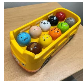
くろくまの 10までかぞえてバス