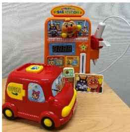
すうじがピピピ! ガソリンスタンドセット

おもちゃのサブスクとは『お子様の成長に合わせて知育玩具のプロが知育おもちゃを選定』し、定期的に入れ替えを行うサービスです。今回は今利用中のおもちゃの一部を紹介します！